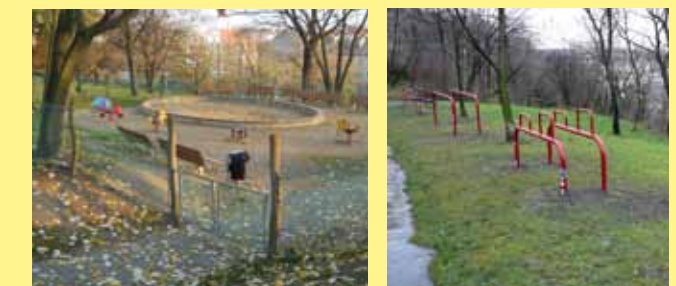
Dětské hřiště Duna a fitness prvky

Armádní muzeum je umístěno v Praze na Žižkově v historických budovách Památníku národního osvobození. Expozice muzea je rozčleněna do tří velkých celků. První zachycuje období první světové války, druhá část je věnována meziválečné Československé republice a jejím ozbrojeným silám a třetí výstavní prostor zachycuje období druhé světové války a mapuje účast Čechů a Slováků ve vojenských operacích na jejich frontách, v domácím odboji i na dalších akcích, které měly za cíl obnovu samostatnosti Československa. Čtvrtá část je věnována příležitostným výstavám. Vedle zbraní je zde vystavena řada unikátních dobových stejnokrojů, praporů, řádů, vyznamenání a rovněž osobních památek na československé presidenty a přední představitele československé armády. GPS: 50°5'15.098"N, 14°26'42.410"E