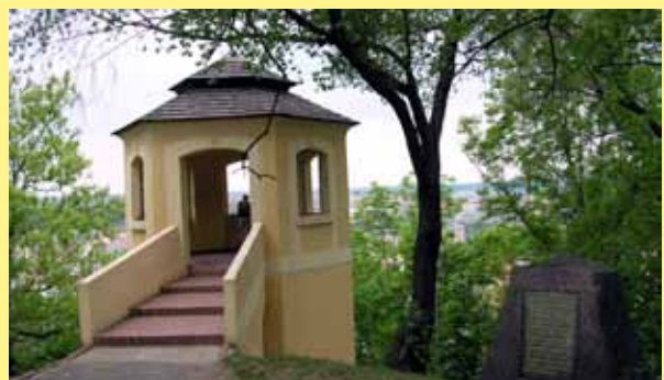
Vyhlička s pamětní deskou k bitvě na Vítkově