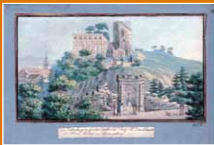
Historická pohlednice - zřícenina Cibulka

Všechny lesy v majetku hl. m. Prahy, tedy i lesy na Cibulce jsou obhospodařovány podle zásad trvale udržitelného hospodaření v lesích. Hl. m. Praha je od května 2007 držitelem mezinárodního, ekologicky velmi přísného lesnického certifikátu Forest Stewardship Council® (FSC®), který hospodaření v lesích směřuje k dosažení přírodních blízkých lesních porostů.