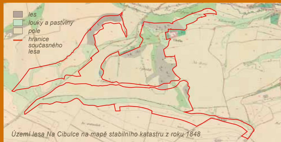
Území lesa Na Cibulce na mapě stabilního katastru z roku 1848

V roce 2000 byla zahájena obnova celého areálu Na Cibulce. Odbor ochrany prostředí Magistrátu hl. města Prahy nechal zpracovat dokumentaci na obnovu stavebních prvků a sochařské výzdoby. Studie se netýká statku a čínské pavilónu, které nejsou v majetku hl. m. Prahy. V roce 2005 byly dokončeny restaurátorské práce a o rok později byly opraveny vodohospodářské prvky (jezíčko Pod Dianou, studánky a propustky pod cestami). V roce 2008 byl obnoven historický ovocný sad pod usedlostí a Čínským pavilónem. V roce 2014 byla provedena oprava rozhledny, poustevny, objektu studánky a také některých soch.