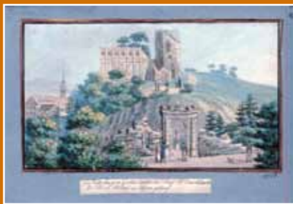
Historická pohlednice – zřícenina Cibulka

Lesy na Cibulce jsou součástí bývalé usedlosti Cibulka, jež svůj název získala podle rodu Cibulovských z Veleslavína, kteří v 15. století vlastnili místní vinice. Původní hospodářská usedlost byla již ve 14. století dědičným dvorem košířské vrchnosti a v té době se nacházela v majetku Jindřicha Náze, písaře královské kuchyně Karla IV. V roce 1815 zakoupil usedlost pasovský biskup Leopold Linhart Thun-Hohenstein, který dal v letech 1817–1826 celý areál upravit a doplnit řadou romantických staveb a soch do podoby anglického parku. Po smrti svého zakladatele přecházela Cibulka na další majitele, pro které však byla spíše přítěží. Na špatný stav celého areálu bylo upozorňováno již v třicátých letech 19. století. Nepomohlo bohužel ani dočasné uzavření parku a vstup pouze na vstupenky. Z poustevny byla ukradena socha poustevníka, stejně jako skleněné zvonky na střeše Čínské pavilónu. Areál Cibulky byl navíc v sedmdesátých letech 19. století zmenšen výstavbou železnice. Ve 20. letech 20. století odkoupila lesopark od tehdejšího majitele J. Hyrouse obec pražská za 1 milion korun. Lesní odbor pražské radnice pak provedl nové výsadby na volných plochách a zamokřené plochy nechal osázet jasaný. Na nátlak tisku a Státního památkového úřadu byly později provedeny úpravy a ohrazení některých staveb v parku. V roce 1972 byly v areálu zrestaurovány vybrané sochy a v rámci lesnického obhospodařování byly upraveny cesty a vystavěn dřevěný altán.