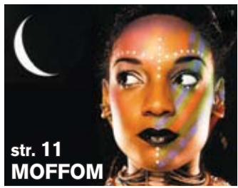
str. 11 MOFFOM