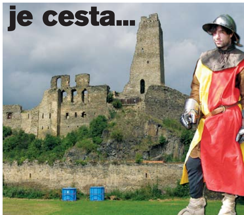
HRAD OKOŘ vystavěl zámožný pražský měšťan, aby se tak vyrovnal šlechtě.

Pokud nechcete cestu zpět absolvovat po stejné trase, lze využít modrou turistickou značku, která vede částečně souběžně s cyklotrasou 0077. Tak se přes Velké Přílepy, Státnice a Únětice dostanete do Roztok. Jestli si chcete ušetřit šlapání do pedálů, můžete