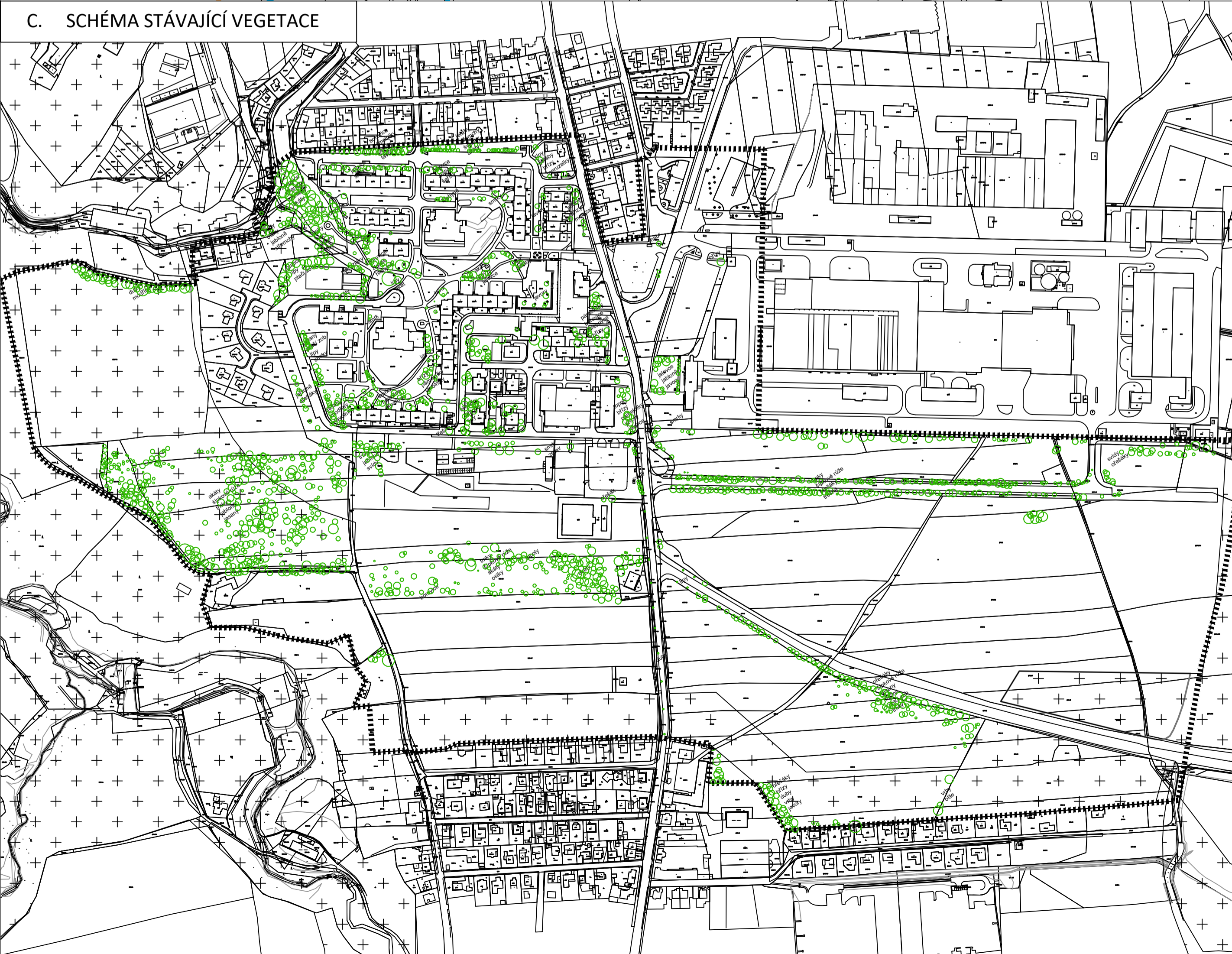
C. SCHÉMA STÁVAJÍCÍ VEGETACE