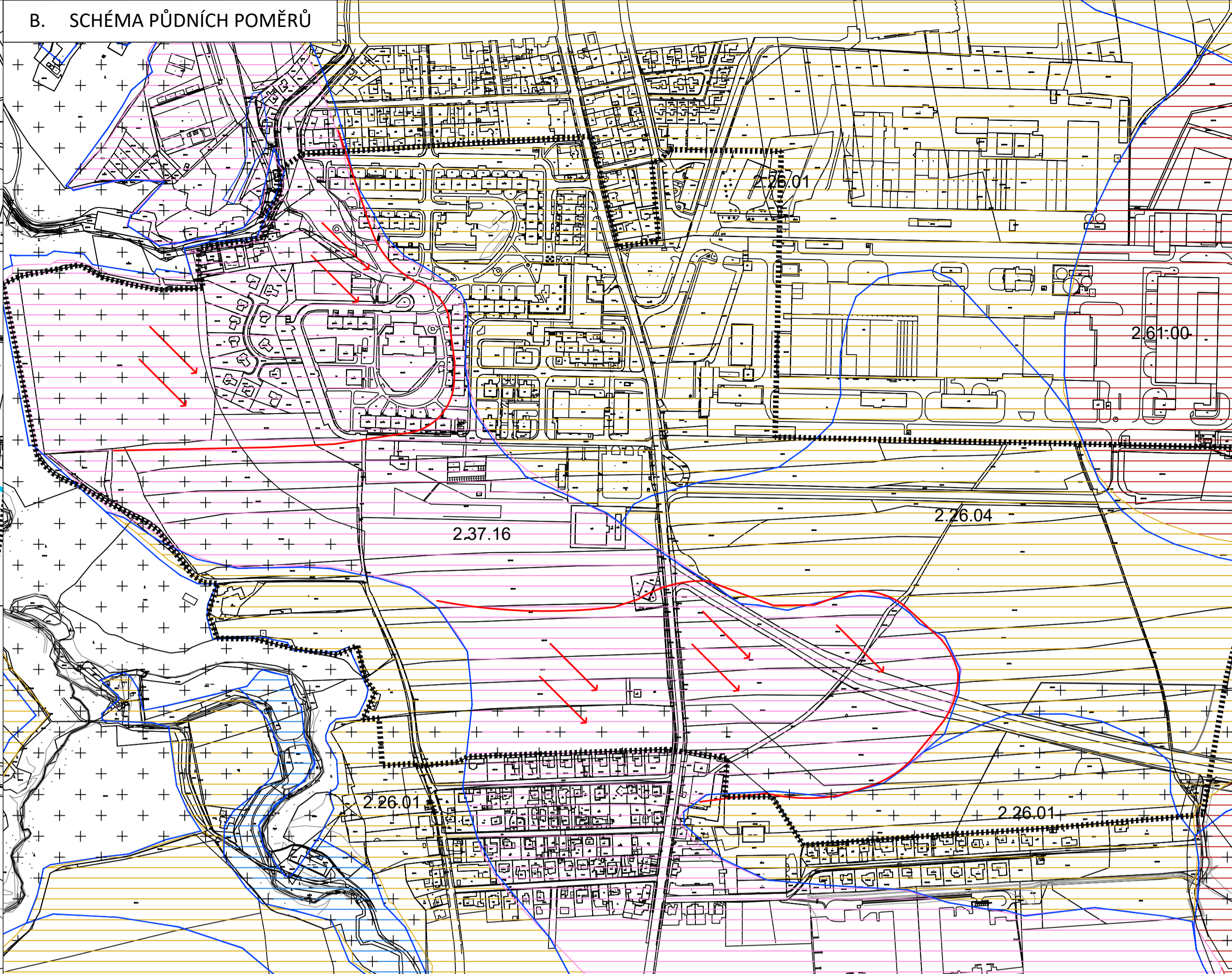
B. SCHÉMA PŮDNÍCH POMĚRŮ