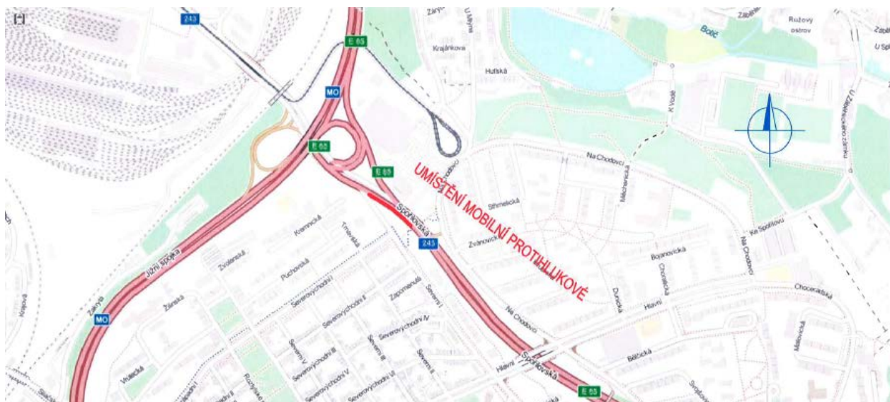
Umístění první části mobilní protihlukové stěny