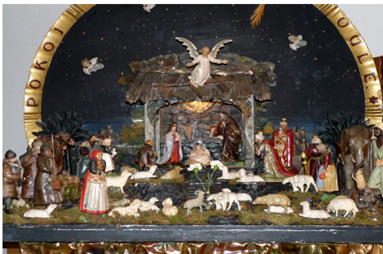
Betlém z kostela Panny Marie Královny Míru