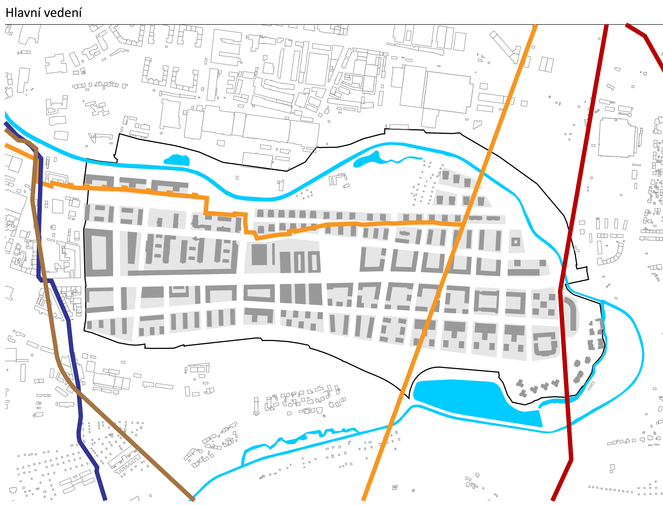
Veřejná prostranství v rámci území přestavby s možností využití stávajících vedení technické infrastruktury